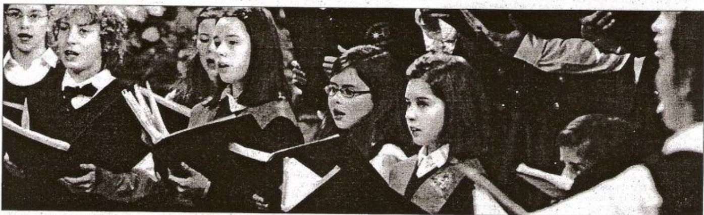
El coro infantil de las Dominicas, durante un concierto de Navidad.

gio en los escenarios del Principado y con actuaciones por diversos lugares de la geografía nacional. Así que no se descarta la posibilidad de que tras el concierto se empiece a pensar en la organización de una gira por Asturias en la que, de la mano de UNICEF, se continuaría recaudando fondos para esta organización humanitaria.